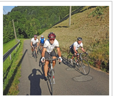
Die Rennradfahrer unterwegs