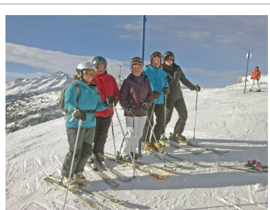
Beim Ski-Opening in St. Anton

Beim Ski-Opening in St. Anton verlebten 21 Teilnehmer bei tollem Wetter und Super-Schnee zwei herrliche Tage. Dabei konnten von verschiedenen Skianbietern Ski kostenlos getestet werden, wovon der eine oder andere Skiclubler auch Gebrauch machte. Für einige war der Moserwirt am Samstagmittag Endstation, und es wurde gefeiert. Die letzten kamen erst um 4 Uhr zur Unterkunft zurück. Auch im Heustadel und der Rodleralm ging bei Livemusik die Post ab. Am Sonntag waren fast alle Bahnen in Betrieb, und bei herrlichem Sonnenschein kam jeder voll auf seine Kosten. Das Hotel Friedheim konnte volles Haus vom SCO vermelden - alle waren gut untergebracht, so dass für nächstes Jahr schon wieder gebucht wurde.