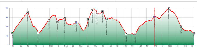
Höhenprofil der MTB-Tour durch den Pfälzerwald

Bei herrlichem Spätsommerwetter waren sieben Skiclub-Mountainbiker unterwegs auf einer Tour, die auf Forstwegen und tollen Trails durch den Pfälzerwald führte. Die Tour startete und endete unter der Ludwigshöhe in der Nähe der Sportschule Edenkoben. Dazwischen erklimmen die Radler pulssteigernde Anstiege und fuhren auf technisch anspruchsvollen Trails. Mit dem Kalmit (673 m) erreichte man den