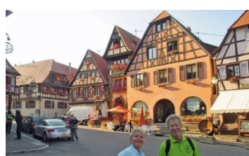
Fachwerkhäuser in Dambach