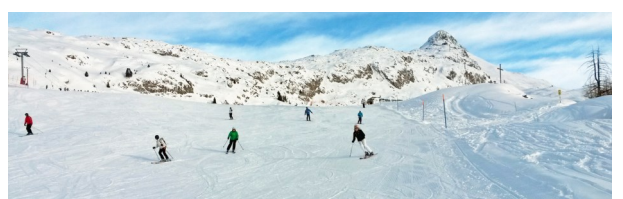
Bei der Ski-Freizeit in Fiesch