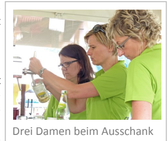
Drei Damen beim Ausschank