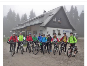
MTB-Tour der Rennmannschaft

tenbrunnen und Unterstmatt zum Ochsenstall wo übernachtet wurde. Am Ende des ersten Tages waren 33 km und 1250 HM auf dem Tacho. Eine kleine Gruppe fuhr noch hinauf zur Hornisgrinde. Leider war der Gipfel mit Wolken verhangen - man konnte keine 10 Meter weit sehen! Am folgenden Tag ging es zunächst bei starker Bewölkung und ca. 14 Grad über den Mummelsee in Richtung Ruhestein. Ab dem Ruhestein wurde aus dem Weiterweg eine Renchtal-Umrandung: über Schliffkopf, Zuflucht, Freiensberg bis zum Löcherberg, wo sich alle für das letzte Stück der Strecke stärkten. Weiter ging es über Löcherbergwasen und die Moos zurück nach Oberkirch. Das Wetter wurde immer besser je näher Oberkirch kam. Am Ende des Tages waren 75 km und nochmals ca. 1250 hm absolviert.