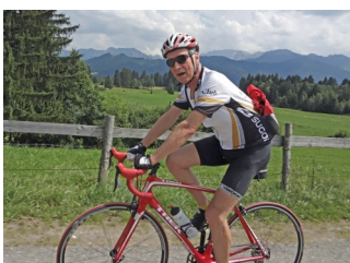
Unterwegs im Allgäu

So langsam näherten sich die Sommerferien. Vorher jedoch startete die Rennradgruppe des Skiclub zu einem dreitägigen Ausflug in die Berge auf den Spuren Ludwig II . Das Allgäu war das Ziel der 16-köpfigen