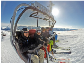
Gondel-Fahren in Damüls

Der zweiten Tag begann wieder mit strahlend blauem Himmel, so dass es gleich nach dem Frühstücksbuffet kein Halten gab. Unzählige Pistenkilometer wurden gesammelt und immer wieder traf man aber auch den ein oder anderen die Sonne genießend beim Après-Ski. Der dritte Tag war mit Pulverschnee und Nebel nicht jedermanns Sache, doch auch da wurde fleißig gefahren. Wegen des Wetters wurde die Abreise eine Stunde vorverlegt, doch das tat der guten Stimmung keinen Abbruch. Es waren drei wundervolle Skitage mit fröhlichen unterhaltsamen Stunden, und für 2015 ist schon fest gebucht!