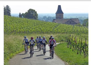
MTB-Tour in den Vogesen

Ebenfalls Ende Mai machten sich 14 Mountainbiker bei idealem Radlerwetter auf zu einer MTB-Tour mit hohem Single-Trail-Anteil in den Vogesen . Gestartet wurde nach Anreise mit den PKW in Barr. Markante Punkte auf der Strecke waren Truttenhausen, der Odilienberg (kräftezehrend!), wo eine kurze Besichtigungs- und Kaffeepause eingelegt wurde, entlang eines Teils der sogenannten Heidenmauer , Champ du Feu (1100 m). Nach einer Rast folgte nun der Höhepunkt der Tour: ein Traumtrail führte die Biker wieder hinunter nach Barr! Die Tour hatte eine Länge von 47 km, von denen ca. 40 km Singletrails waren, und es wurden fast 1200 Höhenmeter zurückgelegt. Nachdem die Räder verstaut waren, ging es mit dem Auto zurück nach Oberkirch.