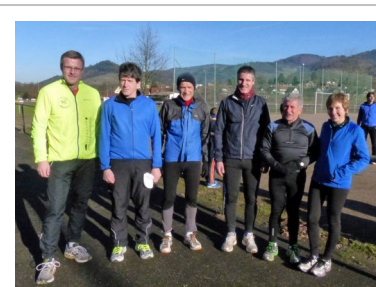
Skiclubler beim Silvesterlauf 2013

Sieben Mitglieder des Skiclub Oberkirch ließen das Jahr 2013 sportlich ausklingen und liefen beim Kappelrodecker/Waldulmer Silvesterlauf mit. Es bestand die Möglichkeit zu walken, eine 5-km- oder eine 10-km-Laufrunde zu absolvieren. Die Skiclubler nahmen die 10 km unter die Füße und legten die Strecke bei traumhaftem Wetter in etwa 55 Minuten zurück. Anschließend saß man noch eine Weile beim Auffüllen der Energiespeicher in geselliger Runde beisammen. Insgesamt waren auf allen gebotenen Strecken mehr als 600 Sportlerinnen und Sportler unterwegs - für den ausrichtenden Verein, den TV Kappelrodeck und die Gemeinde Kappelrodeck ein voller Erfolg.