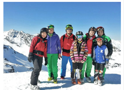
Im Skigebiet Les Trois Vallées

Mitte April hat eine Delegation das größte Skigebiet der Welt im Les Trois Vallées getestet. Dieser Skiverbund liegt im Herzen der französischen Alpen zwischen den "Drei Tälern" von Val Thorens, Méribel und Courchevel. Die französische Superskischaukel bezeichnet sich selbst als das größte zusammenhängende Skigebiet der Welt, und tatsächlich sind alle Gebiete der drei Täler mit insgesamt 600 Kilometern Piste und 180 Skiliften miteinander verbunden. Diese Beschreibung von schneehoehe.de schreitet nach einer Überprüfung durch einen Trupp „grüne Rennfrösche“ von drei Familien des SCO und ihre Eltern. Trotz intensivsten Bemühungen haben sie es in 6 Tagen nicht geschafft, alle Pisten, Skicross-Parks und Funparks abzufahren. Für Freerides hat sich der Altschnee weniger angeboten, obwohl hervorragende Möglichkeiten geboten werden. Was übrig geblieben ist, wird nächstes oder übernächstes Jahr abgehakt. Denn eines war allen klar: Wir kommen bestimmt wieder! (Auszug aus einem Bericht von Jan-Peter Juwana und Thomas Schweiger. Den kompletten Bericht gibt es auf der Homepage des Skiclub zu lesen unter http://www.skiclub-oberkirch.de/text_new.php?ID=1112&kind=N&readonly=true )