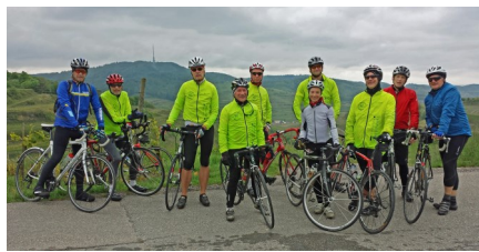
Rennradfahrer vom SCO am Kaiserstuhl