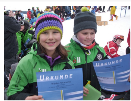
Bei der Wälder-Pokalserie