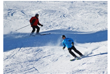
Skifahren im Zillertal