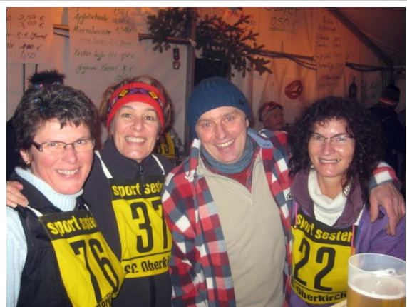
Die Helfer selbst in bester Stimmung