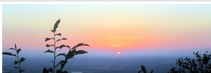
Sonnenuntergang am Schwalbenstein

Am letzten Dienstag vor den Sommerferien traf sich eine große Zahl aktiver Sportler/innen zum gemeinsamen Saisonabschluss der verschiedenen Gymnastikgruppen des Skiclubs beim Schwalbenstein. An diesem schönen Sommerabend mit fantastischer Aussicht auf Oberkirch schmeckten die mitgebrachten Köstlichkeiten und „guten Tröpfchen“ besonders lecker. Der Abend beschenkte allen neben angeregten Gesprächen in lustiger Runde auch noch einen traumhaften Sonnenuntergang. Dies war ein schöner Abschluss einer sportlichen Gymnastik-Saison.