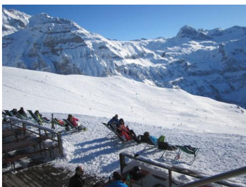
Die Sonne genießen...

Am Fastnachtsdienstag fuhren 8 Skiclubmitglieder kurzentschlossen mit dem Ski-Club-Bus zu einer Tagesskifahrt nach Adelboden in die Schweiz. Bei herrlichem Sonnenschein, super Schnee und einer fantastischen Bergkulisse genossen die drei Frauen und fünf Männer einen traumhaften Skitag. Das Skigebiet Adelboden bietet schöne Pisten in allen Schwierigkeitsgraden und gemütliche Einkehrmöglichkeiten für die notwendigen Pausen. So verbrachten die Skiclubler eine erholsame Mittagspause auf der Sonnenterrasse am