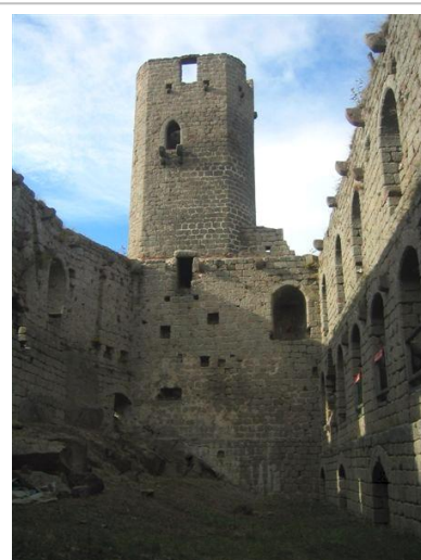
Die Burg Haut-Andlau