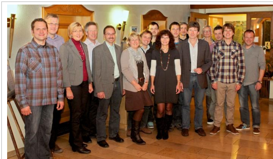
Die Vorstandschaft nach den Neuwahlen 2011