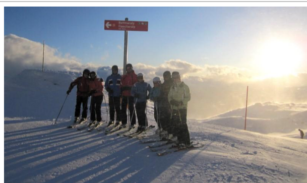
Skifreizeit in Fiesch