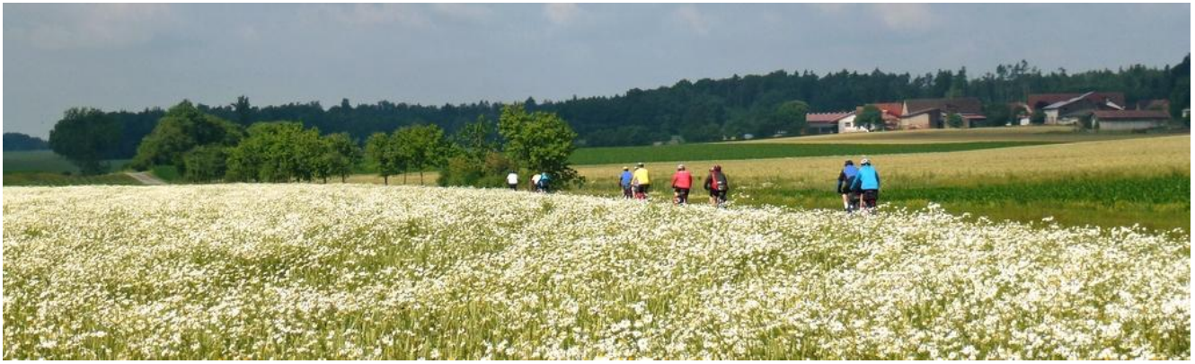
Auf dem „Schmetterlingsradweg“