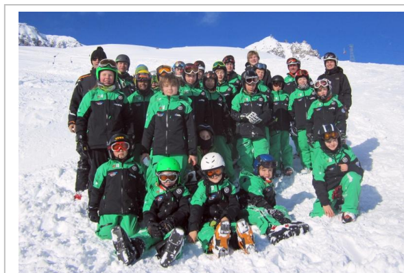
Die neue Teamkleidung

Bei der letzten Station der Rennvorbereitungen für die Rennsaison – in Fiesch – stellten sich Rennmannschaft und Betreuer in ihrer neuen Teamkleidung von Ziener vor. Die Rennläuferinnen und Rennläufer haben sie mit